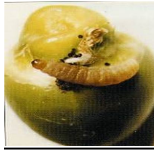
זחל של המזיק