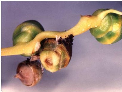
נזר של עש התמר הקטן

עש התמר הקטן מזיק לפרי התמר לא בשל. זחלים של המזיק ניזונים מפירות ומסוגלים לגרום לנזק כלכלי, אובדן יבול עד 75%.