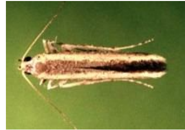
בוגר של עש התמר הקטן